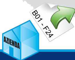
TABELLE DI DESTINAZIONE QUOTE MENSILI EBAV - 1° e 2° Livello